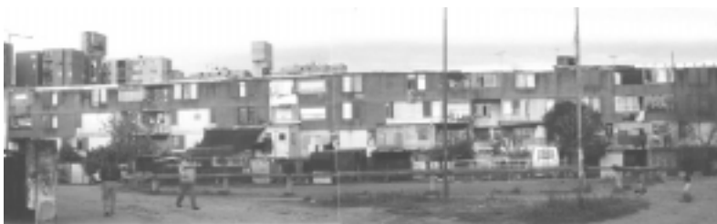
FIGURA 27, OCUPACIÓN DEL ESPACIO PÚBLICO

Los espacios públicos han ido desapareciendo y fueron siendo reemplazados por nuevas construcciones de alta precariedad que se desparraman cual mancha de aceite en el entorno de los edificios del complejo.