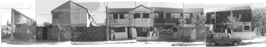
FIGURA 2: VISTA DE UNA MANZANA DESDE LA CALLE CENTRAL

La superficie común queda materializada por pasillos exteriores, que permiten el acceso a algunas viviendas, mientras que otras lo hacen directamente desde la vía pública y un tercer grupo a través de la calle peatonal central pública.