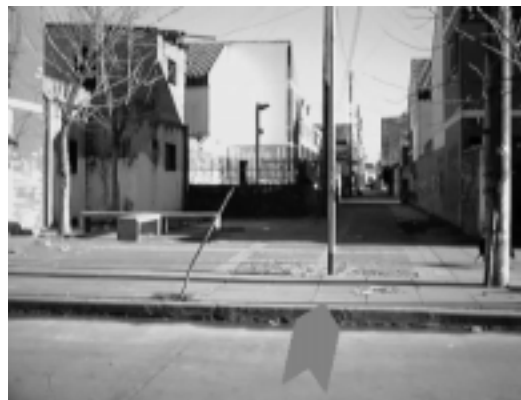
FIGURA 3: PLANTA DE CONJUNTO