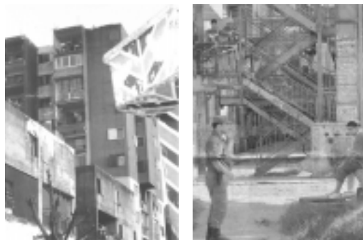
FIGURAS 28 Y 29: DETERIORO, MARGINALIDAD

Espacio público, escaleras, ascensores y nudos circulatorios muestran la desidia de un Estado Ausente que no asume su rol de articulador de acciones que den respuesta a una ciudadanía que ha quedado en el mayor abandono.