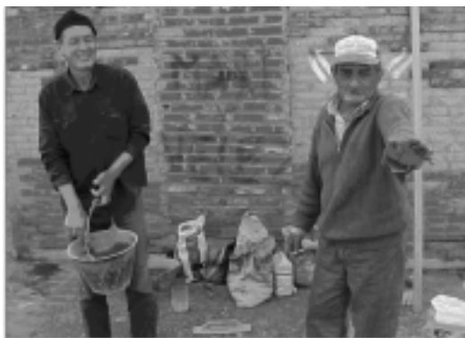
FIGURAS 12 Y 13: REPARACIONES APROPIADAS

Estaba destinado a asistir a proyectos emergentes del diagnóstico de las necesidades sociales prioritarias a partir de la participación de instancias organizativas públicas y organizaciones comunitarias. En este sentido el Programa enunció dentro de la tipología de proyectos seleccionados, los correspondientes al mejoramiento de las condiciones de habitabilidad de las viviendas e infraestructura, explicitando dar inicio inmediato a las obras en el barrio Illia . Para ello especificó que dichos trabajos de recuperación edilicia se desarrollarían de acuerdo a los estudios previos realizados por grupos de la FADU-UBA contratados por la CMV para su diagnóstico y evaluación.