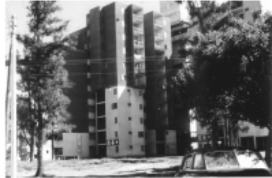
FIGURAS 20, 21 Y 22: LAS TORRES, LOS PUENTES, LAS TIRAS

La adjudicación de las viviendas fue altamente conflictiva en concordancia con los conflictos políticos de la época. (Lanusse; Cámpora; Perón; Isabel Perón). No sólo se adjudicaron viviendas a los antiguos habitantes de la Villa 31 sino a distintos grupos relacionados con el poder, no necesariamente de los asentamientos conocidos como “villas”. Durante los años 1976 – 1983 fueron llegando al barrio ex residentes de distintas villas de la capital desalojadas y demolidas por el entonces Intendente de la Capital. En dicho período muchos de los locales comerciales fueron transformados en viviendas.