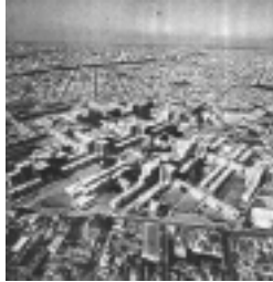
FIGURA 18: VISTA AÉREA