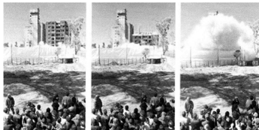
FIGURAS 24, 25 Y 26

La acción del Estado mostró contradicciones. “Si bien el Estado sostiene la necesidad de adoptar medidas de una urgencia tal que viola en forma flagrante el derecho de los vecinos, por otro, mientras tenía a disposición desde 1993 la información sobre la necesidad de realizar reparaciones no hizo absolutamente nada, ni siquiera notificar a los vecinos del supuesto riesgo que corrían e impulsar la adopción de medidas de prevención. Resulta evidente que no era la vida de los vecinos lo que interesaba al Estado”. ▶ 8