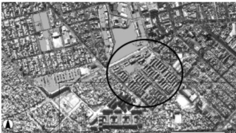
FIGURA 1: VISTA AÉREA DEL BARRIO ILLIA Y SU ENTORNO