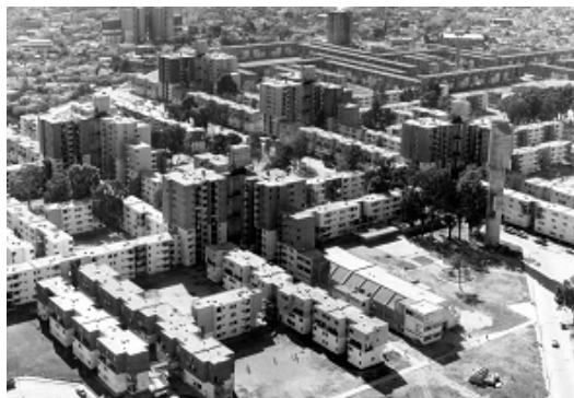
FIGURAS 16:FOTO AÉREA DE CONJUNTO

El presente estudio propone la elaboración de un diagnóstico expeditivo que comprende: población, educación, salud, ocupación, estado de titularidad, estado físico del conjunto habitacional, equipamiento, accesibilidad, otros servicios; incorporando la propuesta de programas de recuperación y proyectos estratégicos de actividades en el marco de una planificación de rehabilitación físico-espacial integrada a un plan de desarrollo sostenible para la comunidad involucrada.