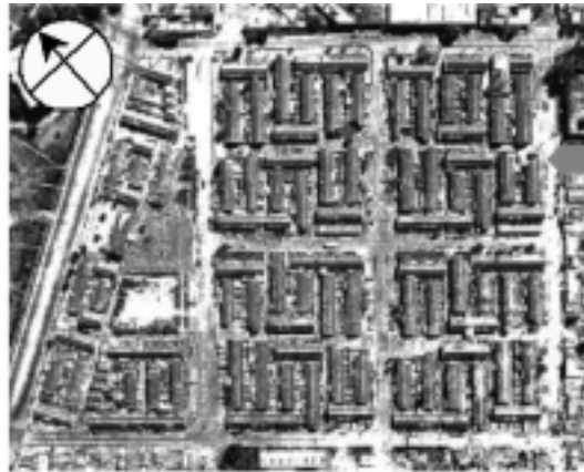
FIGURA 4: CALLE PEATONAL CENTRAL MANZANA

El sistema constructivo de proyecto fue el tradicional racionalizado, con muros compuestos de ladrillo común visto y techos de tejas francesas, conformando una silueta urbana, típica de los barrios