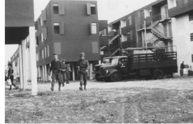
FIGURA 19: 1973, EL EJÉRCITO EN EL BARRIO

Totalizaban 425 departamentos de 2 dormitorios, 336 de 3 dormitorios, 157 de 4 dormitorios y 42 de 5 dormitorios, con una población prevista de 5392 personas .