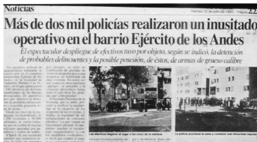
FIGURA 23: 1984, LA POLICÍA EN EL BARRIO

Esta situación se repitió tiempo después en el nudo 9. Dichos movimientos se debieron, como habría de constatarse posteriormente, a vicios en la construcción.