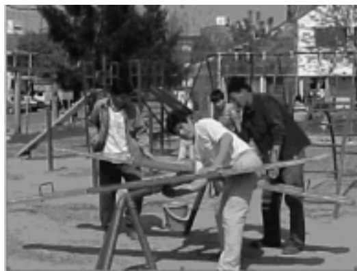
FIGURAS 14 Y 15: OPERARIOS REPARANDO PLAZA CENTRAL Y PINTANDO EN LA PLACITA

Con este esquema organizativo, a modo de síntesis, se realizaron tareas para dar solución a las juntas de unión platea – cerramiento, cambio de placas cerámicas y tomado de juntas, sustitución de umbrales, prueba piloto para la reparación de las juntas entre paneles y colocación de alero, realización de rejillas y rejas metálicas faltantes y de seguridad, trabajos en las instalaciones internas de las viviendas y en la infraestructura del barrio –pérdidas en las redes de provisión de agua y gas, y en la de desagüe cloacal, colocación de losetas de veredas.