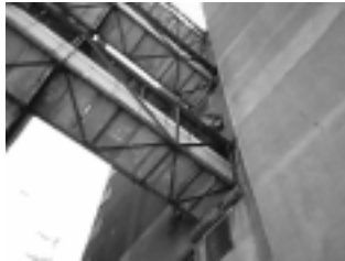
FIGURAS 30, 31 Y 32: MÁS DE 30 AÑOS DE DESIDIA Y ABANDONO POR PARTE DEL ESTADO

El 22 de enero de 2004 vecinos y representantes de las distintas instituciones que funcionan en el barrio presentaron ante las autoridades un petitorio consensuado, resultado de la reflexión conjunta. El documento se denominó: