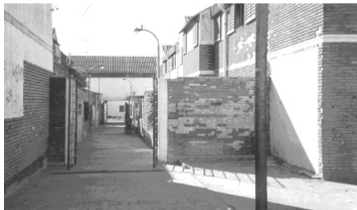
FIGURAS 10 Y 11: ESPACIOS EXTERIORES: CALLE PÚBLICA PEATONAL Y PASAJE INTERIOR