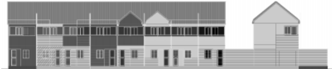
FIGURA 6: VISTA. SECTOR TIRA VIVIENDAS