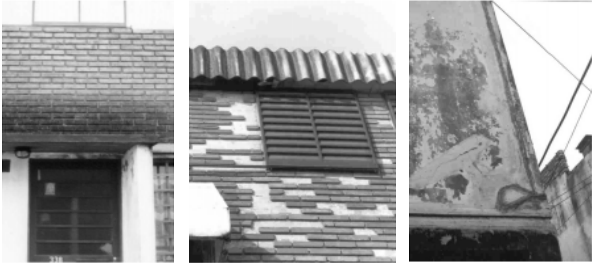
FIGURAS 7, 8 Y 9: PATOLOGÍAS EN CERRAMIENTOS

El resto de las patologías detectadas se programarían de acuerdo a las posibilidades presupuestarias y de organización de la CMV. Para cada una de las patologías se estableció: descripción, ubicación en la unidad de vivienda, diagnóstico, gravedad, propuesta de solución, unidad de medida e inventario por manzana y total.